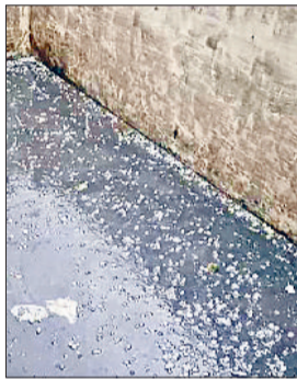
कैथल। सीवन में हुई ओलावृष्टि।

जिले में हुई बूंदबांदी तथा हलकी बारिश ने किसानों को काफी राहत देने का कार्य किया है। बारिश तथा बूंदबांदी के रूप में आसमान से खेतों में सोना बरसा है। बूंदबांदी का सिलसिला दिन से रूक-रूक कर बीती देर रात तक जारी रहा। जिसके चलते अधिकतम तथा न्यूनतम तापमान में गिरावट दर्ज की गई। पिछले 24 घंटों के दौरान जिले औसतन साढ़े चार एमएम बारिश दर्ज की गई है। जींद में 3.5 एमएम, नरवाना तथा सफीदों में तीन-तीन एमएम जुलाना में 9.6 एमएम, उचाना में 8 एमएम, पिल्लूखेड़ा में पांच एमएम तथा अलेवा में बूंदबांदी दर्ज की गई है। वीरवार को दिनभर मौसम परिवर्तनशील बना